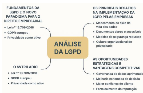
Figura 2. LGPD no Direito Empresarial: Desafios, Fundamentos e Oportunidades Estratégicas.

Diante disso, a análise da LGPD pode ser organizada em três grandes eixos. O primeiro diz respeito aos fundamentos da lei e ao novo paradigma para o direito empresarial, destacando a Lei nº 13.709/2018, sua inspiração no GDPR europeu e a concepção da privacidade como um ativo estratégico para as organizações. O segundo eixo abrange os principais desafios de implementação, que incluem o mapeamento do ciclo de vida dos dados, a necessidade de elaborar documentos claros e acessíveis, a adoção de medidas de segurança robustas e a promoção de uma cultura organizacional de privacidade. Por fim, o terceiro eixo evidencia as oportunidades estratégicas e vantagens competitivas que a conformidade com a LGPD pode proporcionar, tais como a melhoria da governança de dados, o aperfeiçoamento da tomada de decisão, o aumento da confiança dos clientes e o fortalecimento da reputação institucional (Figura 2).