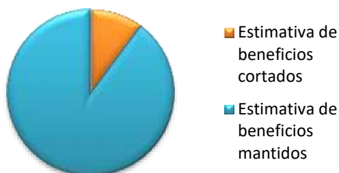
Gráfico 1 - Estimativa do impacto do "pente-fino" no BPC/LOAS.