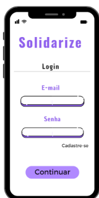
Imagem 2: Tela de Login.

Com base na escolha do usuário será apresentada ou a tela de cadastro, ou a tela de login, ilustrada na imagem 2 e 3 a seguir.