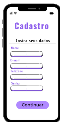
Imagem 3: Tela de Cadastro.

Após o login, o usuário será direcionado para a tela de Dashboard, onde poderá visualizar as doações disponíveis e também terá a opção de publicar sua própria doação. As funcionalidades estão ilustradas nas imagens 4 e 5 abaixo.