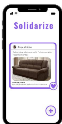
Imagem 4: Tela de Dashboard.