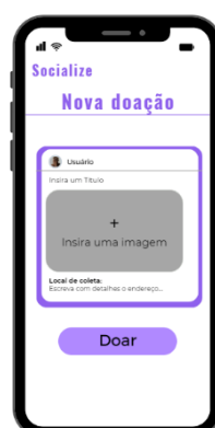
Imagem 3: Tela de Nova Doação.