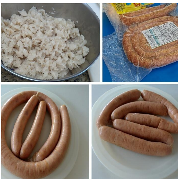
Figura 2. Produto final da linguiça desenvolvida com CMS de pirarucu ( Arapaima gigas ).

Ao término das etapas de processamento descritas anteriormente, obteve-se o produto final (Figura 2).